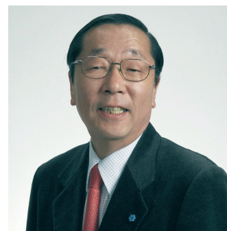
Dr. Masaru Emoto