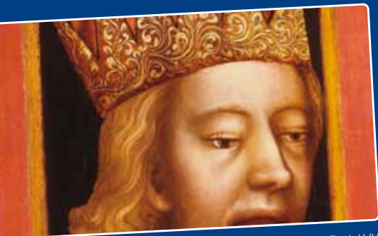
Bildausschnitt: Porträt Herzog Rudolf IV (das älteste gemalte Porträt des Abendlandes) im Dommuseum Wien, um 1365, Tempera auf Pergament, 39 x 22 cm

Dann hören Sie uns. Große Werke großer Meister – kunsthistorisch beleuchtet von Kuratoren, Samm- lern und Museumsdirektoren. Visuelles akustisch interpretiert.